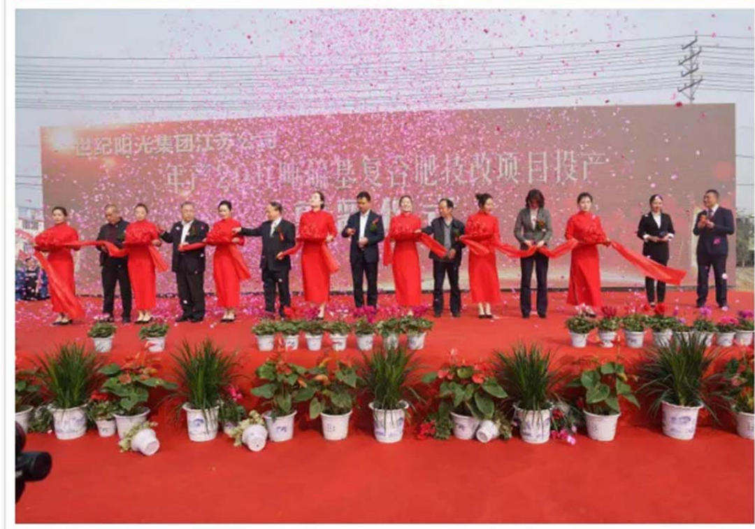
上：嘉宾为年产 5000 万平方米高端石膏板项目奠基