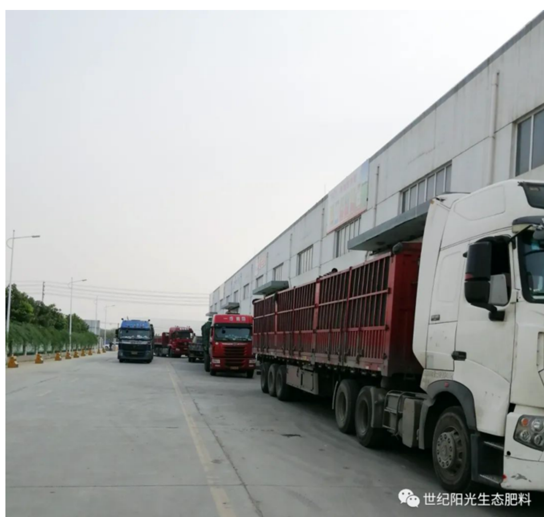
集团江苏生产基地拉货车辆排成长龙

由于今年夏季雨水偏多，秋季用肥相对往年有所延后，即便是国庆假期，复合肥发货、装车依然一片繁忙。