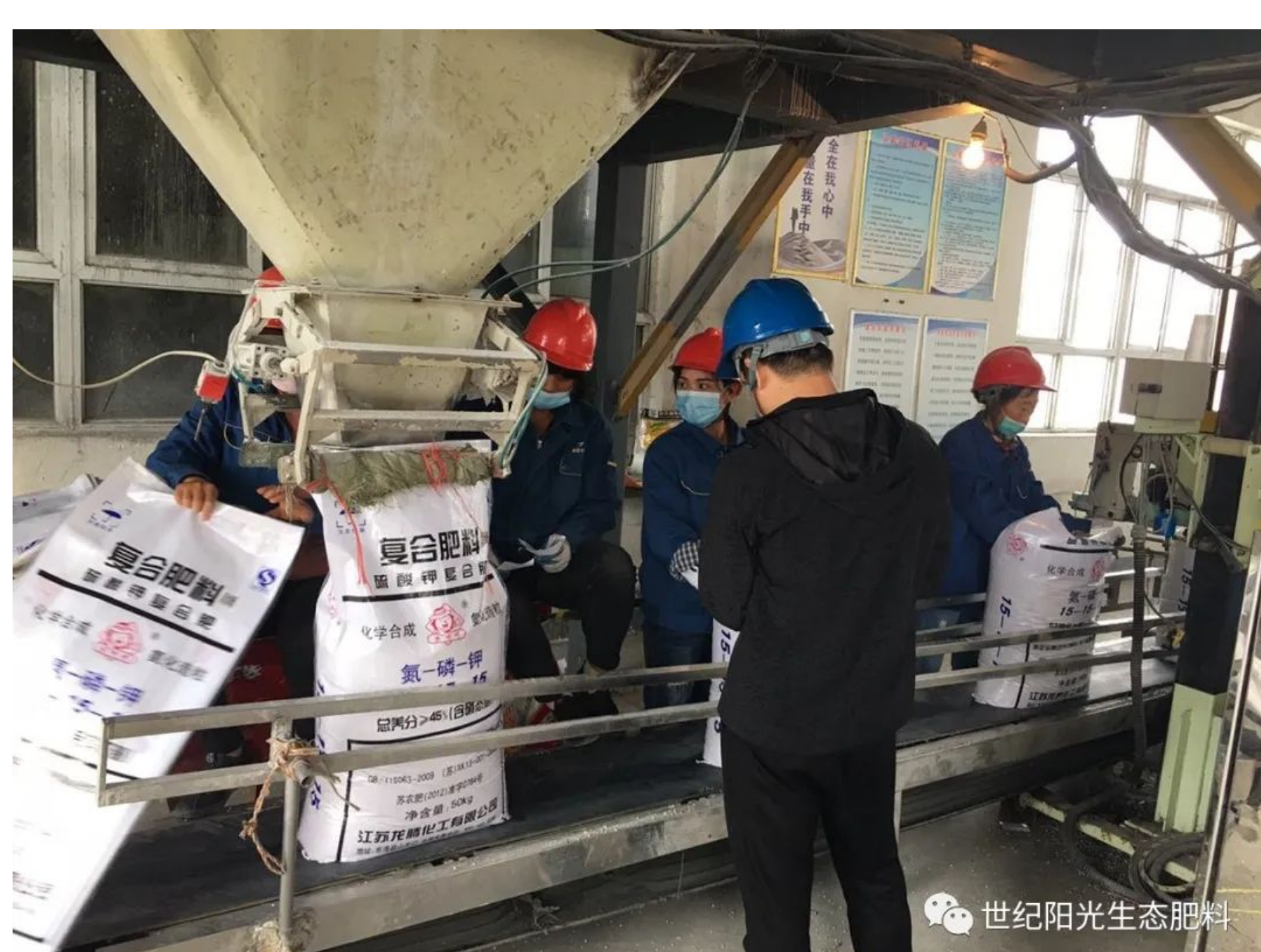
硫基氨化复合肥包装现场

由于今年夏季雨水偏多，秋季用肥相对往年有所延后，即便是国庆假期，复合肥发货、装车依然一片繁忙。