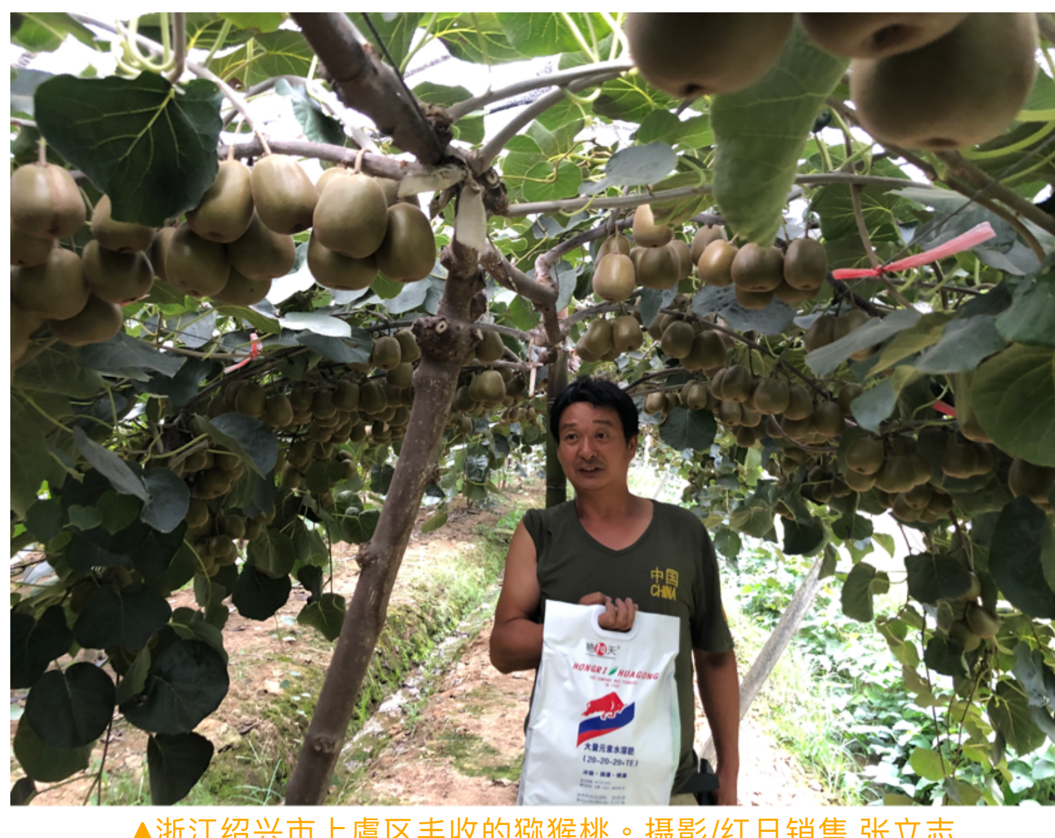
▲浙江绍兴市上虞区丰收的猕猴桃。

一年一度秋风劲 又到收获的季节 丰收 是中国人刻在骨子里的期盼 大江南北处处金黄翠绿 目光所及之处皆是喜悦的笑脸